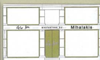
Δημ. Θέμελη 83