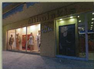
Αγ. Ιωάννου και Γρ. Αυξεντίου 178