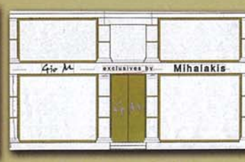
Δημ. Θέμελη 83