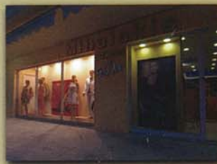
Αγ. Ιωάννου και Γρ. Αυξεντίου 178