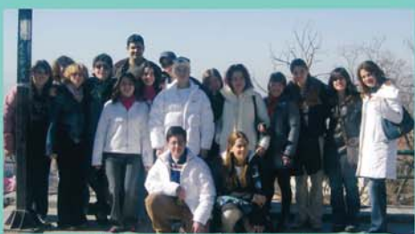
Γ' Γυμνασίου & Α' Λυκείου στη Θεσσαλονίκη