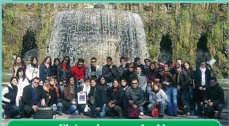
Γ' Λυκείου στην Ιταλία