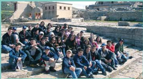
Α' & Β' Γυμνασίου στην Κρήτη