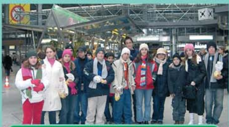
Οι μαθητές μας στο Μόναχο