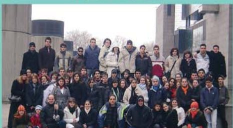
Β' Λυκείου στο Παρίσι