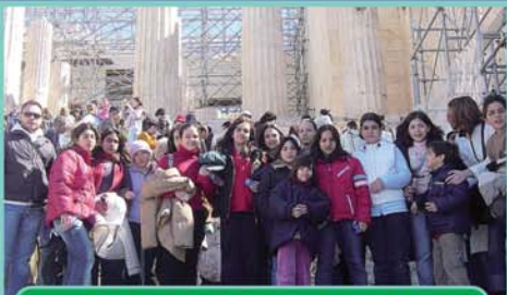
Μαθητές της Στ Δημοτικού στην Αθήνα